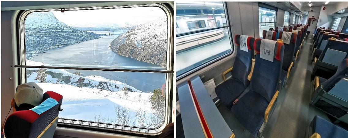
* Trem regular de Kiruna a Narvik em classe econômica.