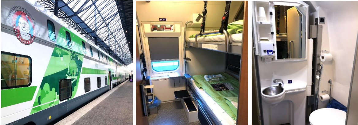
*Trem noturno entre Helsinki a Rovaniemi – Cabine dupla com duas camas (beliche) e banheiro privativo.